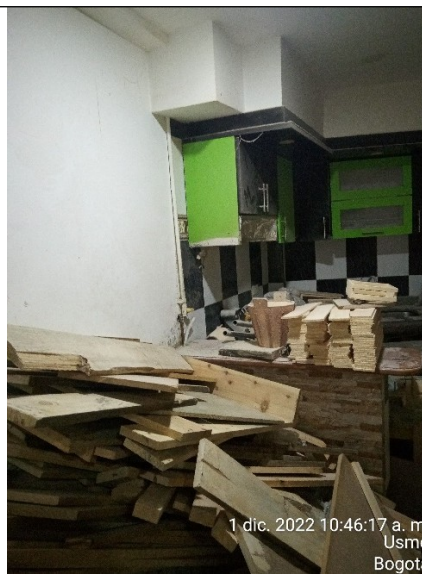
FOTOGRAFÍA No. 8. Área de armada de productos.