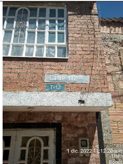
FOTOGRAFÍA No. 2. Nomenclatura del predio