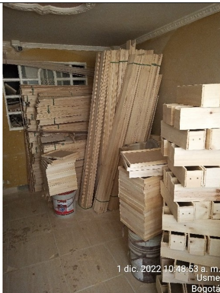
FOTOGRAFÍA No. 3. Área de almacenamiento de materias primas