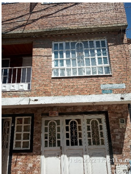
FOTOGRAFÍA No. 1. Fachada