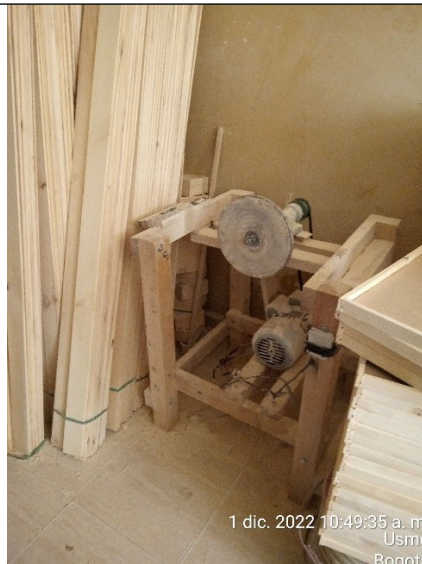
FOTOGRAFÍA No. 6. Lijadora eléctrica.