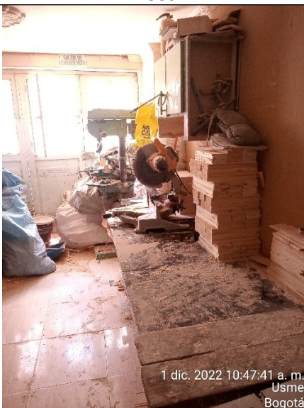
FOTOGRAFÍA No. 7 Colilladora.