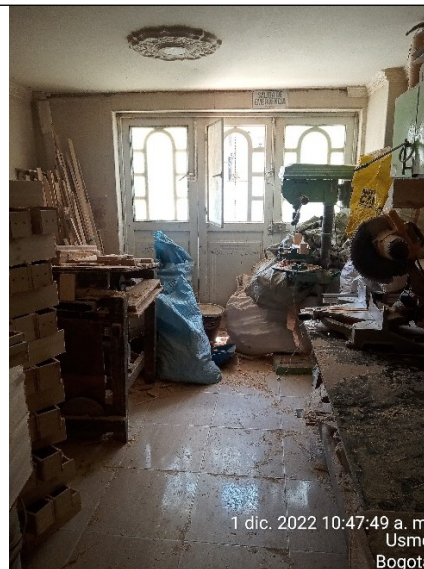
FOTOGRAFÍA No. 4. Área de los procesos de corte y lijado