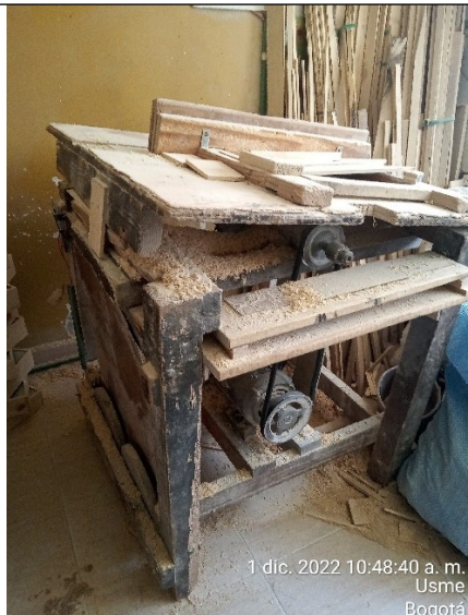
FOTOGRAFÍA No. 5 Sierra de mesa.